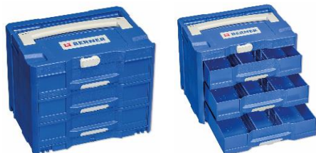
Abbildung 3: BERA Clic+ mit Schubladen (Artikelnr. 377802); 396 x 263 x 296 mm (B x H x T)

Albert Berner Deutschland GmbH Bernerstraße 4 D-74653 Künzelsau www.berner.de