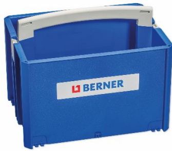
Abbildung 4: BERA Clic+ Toolbox Gr. 2 (Artikelnr. 337799); 396 x 263 x 296 mm (B x H x T)

Albert Berner Deutschland GmbH Bernerstraße 4 D-74653 Künzelsau www.berner.de