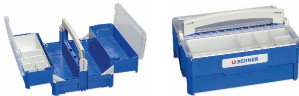
Abbildung 1: BERA Clic+ Werkzeugbox (Artikelnr. 337798); 396 x 160 x 296 mm (B x H x T)