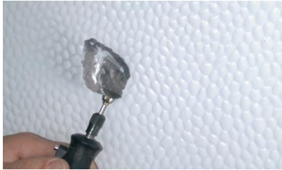
Schritt 1: Lackentfernung