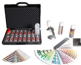
Caravan Spot Repair

Albert Berner Deutschland GmbH Bernerstraße 4 D-74653 Künzelsau www.berner.de