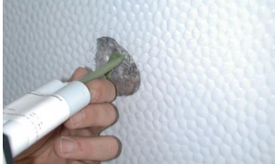
Schritt 2: Einfüllen der Spachtelmasse in Beschädigung