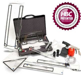
Das Caravan Repair System von HBC