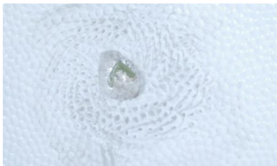
Strukturabdruck auf der Spachtelmasse.

Albert Berner Deutschland GmbH Bernerstraße 4 D-74653 Künzelsau www.berner.de