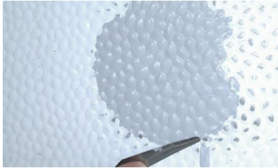
Schritt 5: Aushärten und Nachschleifen