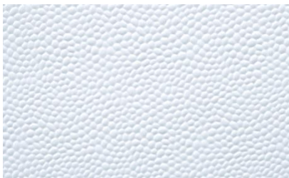
Ergebnis nach finaler Lackierung