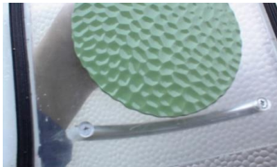
Schritt 4: Übertragen des Musterabdrucks mithilfe der Vakuum-Werkzeugplatte und einer flexiblen Kunststoffmasse